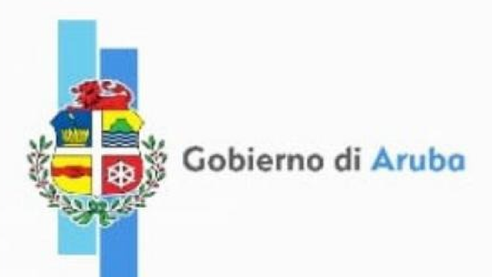
De uitgaven van Aruba zijn onder de internationale gemiddelde